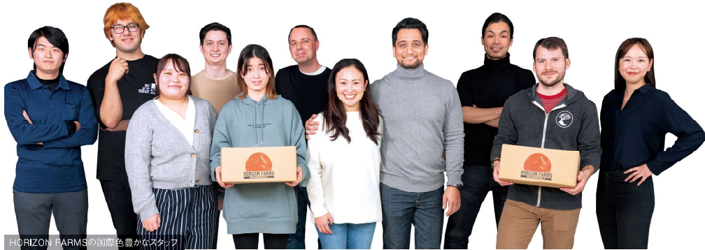
HORIZON FARMSの国際色豊かなスタッフ