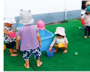
同社運営の社内託児所で遊ぶ子どもたち

「食の半導体」である液卵の安定供給を使命に掲げ、信頼と実績を強みに2025年3月期で11年連続増益と売上高250億円、経常利益30億円を達成する見込みだ。一方、24年7月にオーガニック食品の輸入、EC販売の企業をM&AしオーガニックEC事業もスタートするなど、未来を見据えた挑戦を続けている。